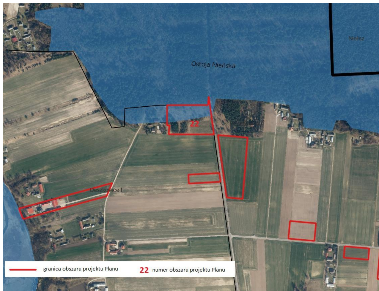
Rys. nr 2. Położenie fragmentu obszaru projektu Planu w obrębie Deszkowice I na tle granicy Obszaru Specjalnej Ochrony Ptaków „Ostoja Nieliska”.

Pozostałe obszary projektu Planu leżą poza obszarowymi formami ochrony przyrody, ale formy te rozciągają się w ich sąsiedztwie, w tym bezpośrednim (rys. nr 3).